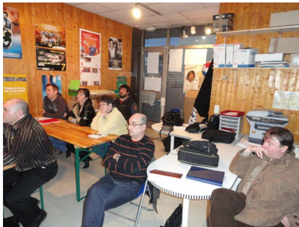
Figure 5: Une écoute attentive

La soirée s'est terminée par un petit buffet.