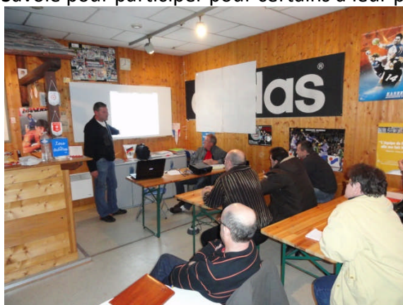
Figure 1: Les accompagnateurs à l'écoute...

Les tuteurs de JA club étaient au rendez vous lundi soir au comité de handball de Haute Savoie pour participer pour certains à leur première formation d'accompagnateur.