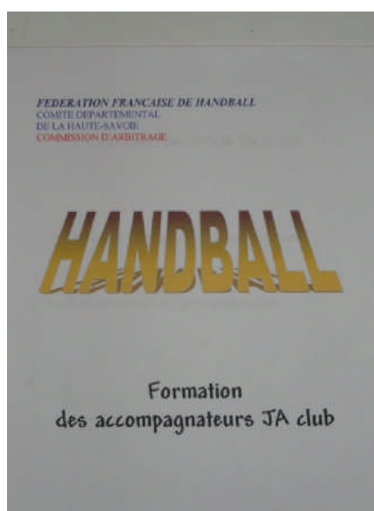
Figure 3: La page de garde du document présenté

Lors de cette formation le rôle du tuteur avant, pendant et après le match à été abordé.