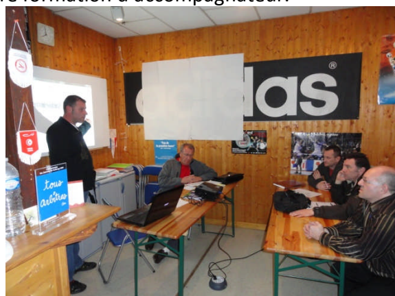
Figure 2: du président de la cda74

La formation organisée par la CDA74 a rassemblé 10 accompagnateurs qu'il faut ajouter à ceux ayant participé à la formation de début d'année.