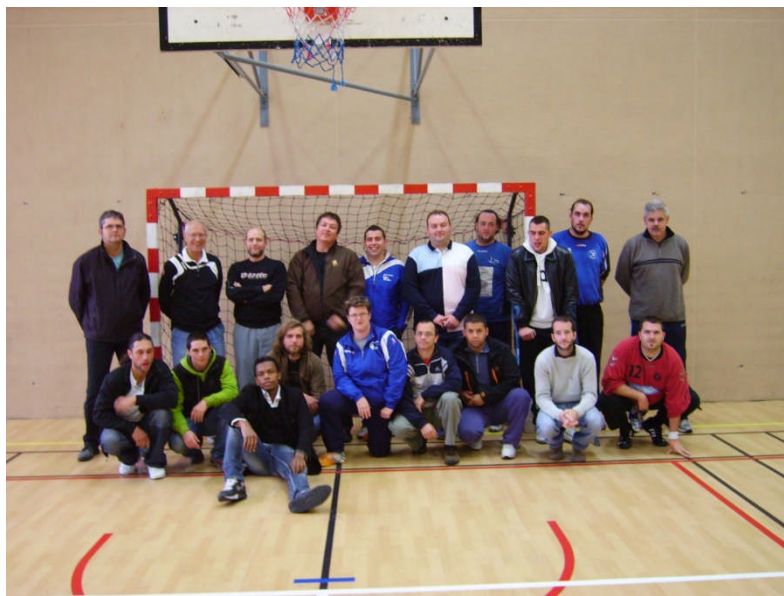
Figure 1: Les arbitres seniors départementaux

Tous les arbitres se sont réunis au gymnase de Thonon, le samedi et le dimanche pour les jeunes arbitres et le dimanche uniquement pour les seniors.