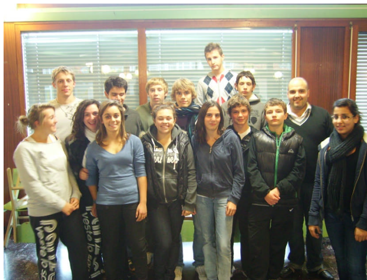
Figure 2: Des jeunes arbitres présents au stage