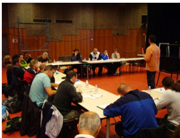
Figure 4: Les nouvelles règles ont amené un débat animé et constructif

Le stage senior lui avait pour but de réunir les arbitres officiant au niveau départemental afin de leur donner les consignes de la saison et de leur faire un rappel sur les nouvelles règles.