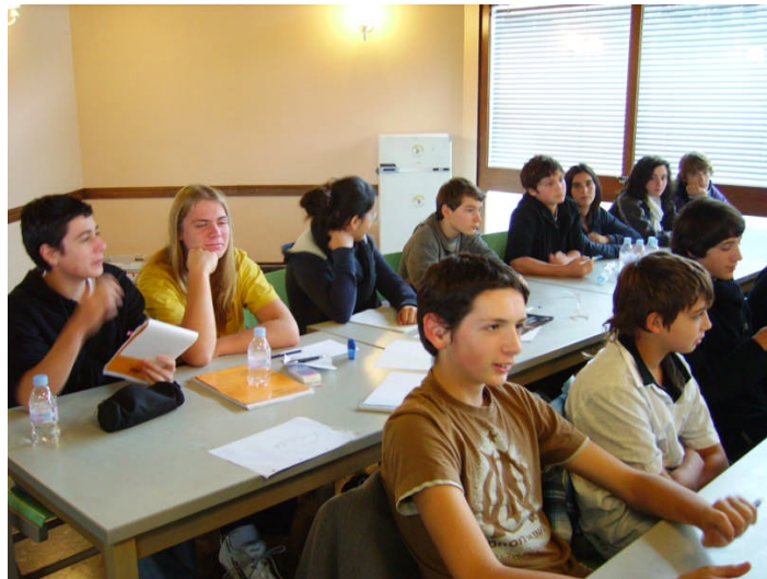
Figure 3: Les JA en pleine formation

Le but affiché étant de leur donner des axes de travail pour leurs progrès et de détecter des potentiels intéressants.